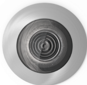
ACTUAL SIZE, -AN FINISH • TAILLE RÉELLE, FINI -AN