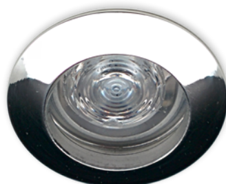
-CR FINISH • FINI -CR