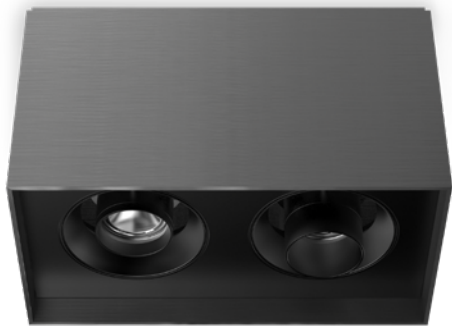
CUSTOM VERSION • VERSION SUR-MESURE