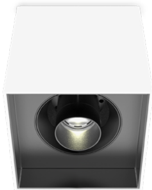
LONG SNOOT VERSION • VERSION PORTE LENTILLE-LONG