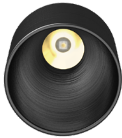
-AB FINISH • FINI -AB