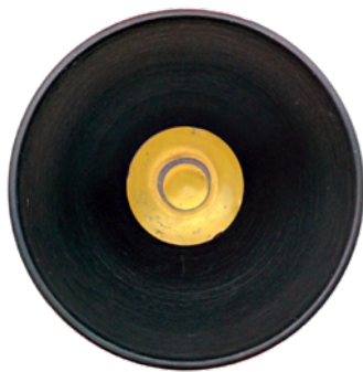
ACTUAL SIZE, -AB FINISH • TAILLE RÉELLE, FINI -AB