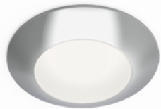
-CR FINISH • FINI -CR