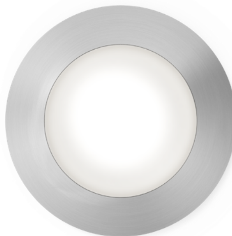
ACTUAL SIZE, -AN FINISH • TAILLE RÉELLE, FINI -AN