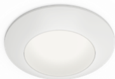
-WH FINISH • FINI -WH