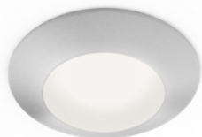
-AN FINISH • FINI -AN