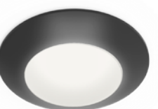
-BK FINISH • FINI -BK