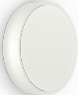
-WH FINISH • FINI -WH

Round indirect LED to be installed as step-light or furniture-light. Made of solid machined aluminum.