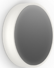
-BK FINISH • FINI -BK