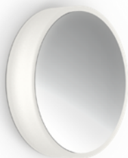
-CR FINISH • FINI -CR