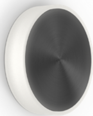
-AB FINISH • FINI -AB