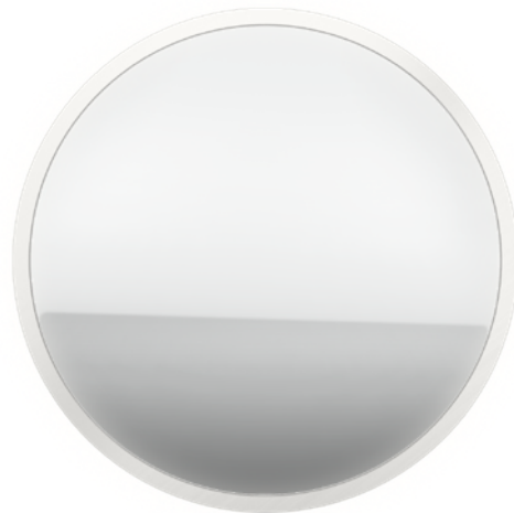
ACTUAL SIZE, -CR FINISH • TAILLE RÉELLE, FINI -CR

Marqueur lumineux rond indirect au LED, à encastrer dans un escalier ou dans un meuble. Fabriqué en aluminium machiné.