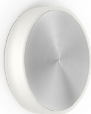
-AN FINISH • FINI -AN