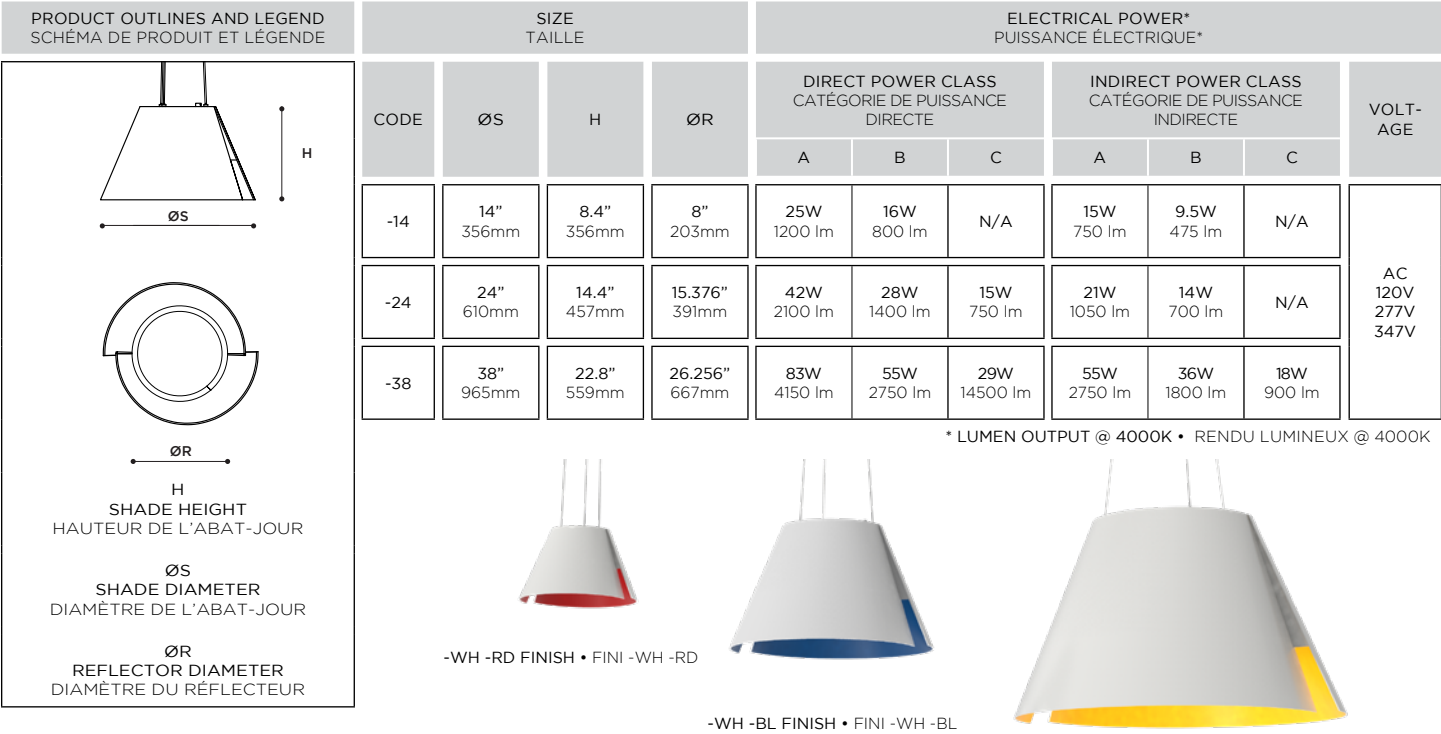
TABLE 1 : DIMENSIONS & ELECTRIC SPECIFICATIONS TABLEAU 1 : DIMENSIONS & SPÉCIFICATIONS ÉLECTRIQUES