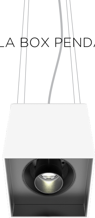
LONG SNOOT VERSION • VERSION PORTE LENTILLE-LONG