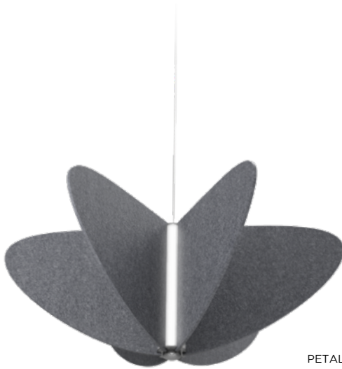
PETAL • PÉTALE

A unique suspended light fixture combining powerful LED lighting with 6 layers of acoustic felt. Ideal for noise reduction in open spaces, this product also stands out with its original flower shaped structure. Available in different color combinations.