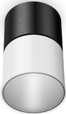
-WH -AB FINISH • FINI -WH -AB